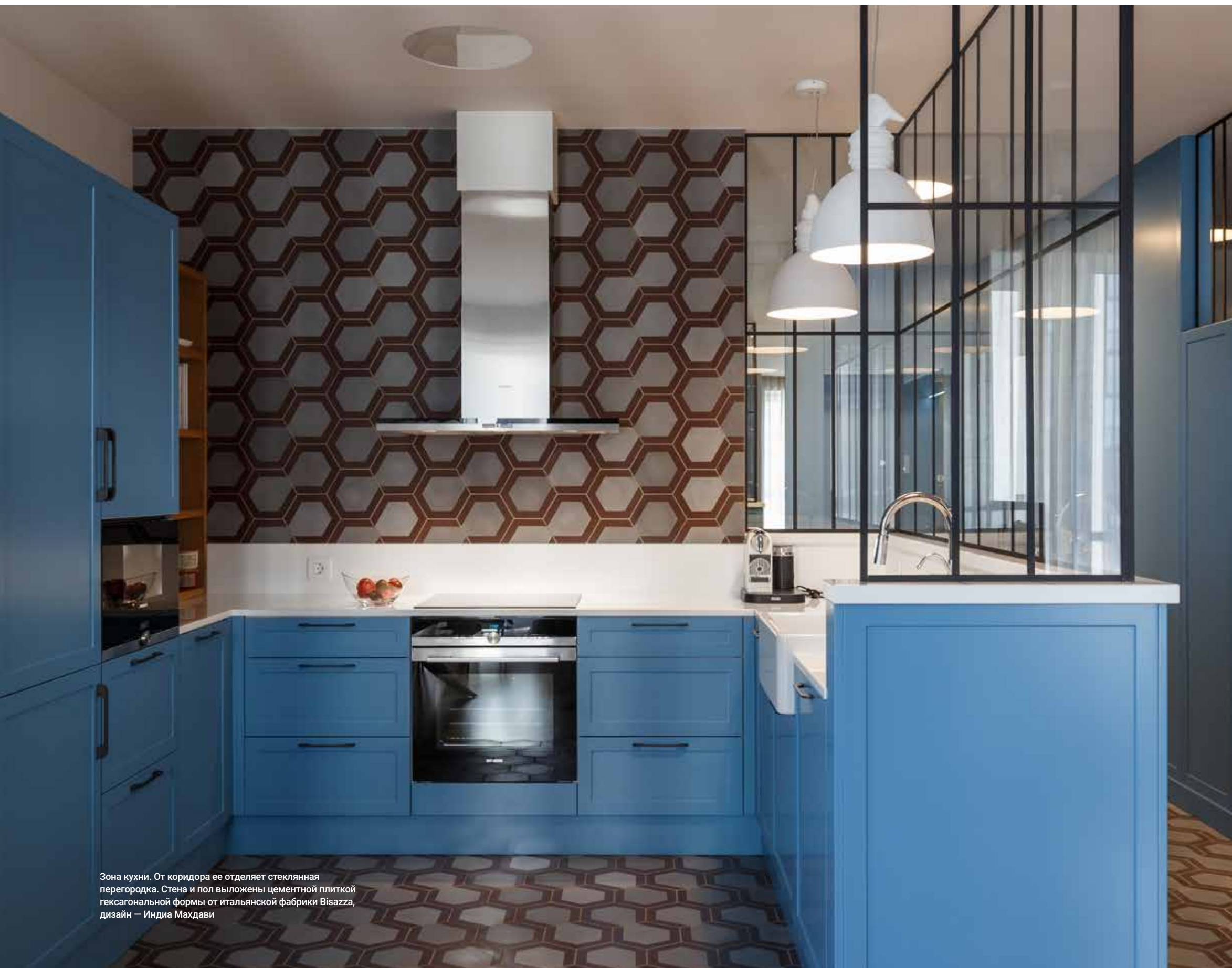
Зона кухни. От коридора ее отделяет стеклянная перегородка. Стена и пол выложены цементной плиткой гексагональной формы от итальянской фабрики Bisazza, дизайн — Индиа Махдави