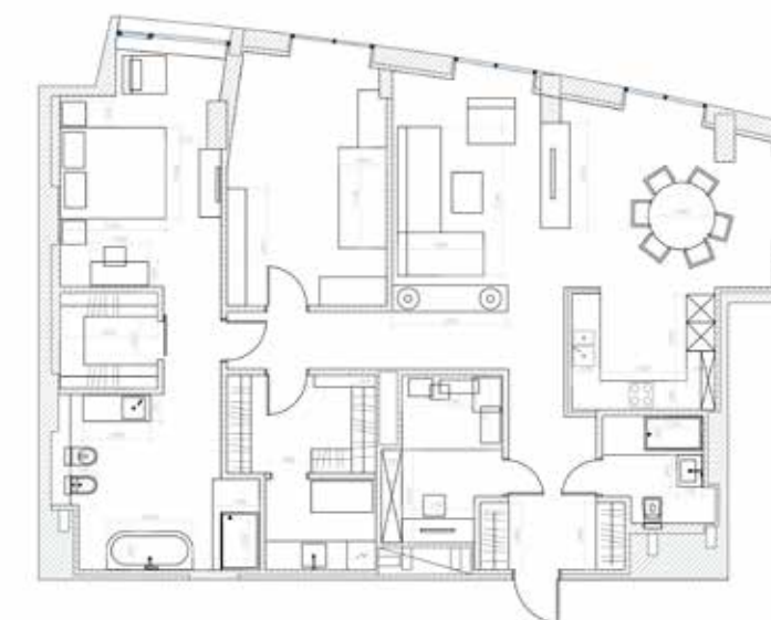
Аватар с периметры